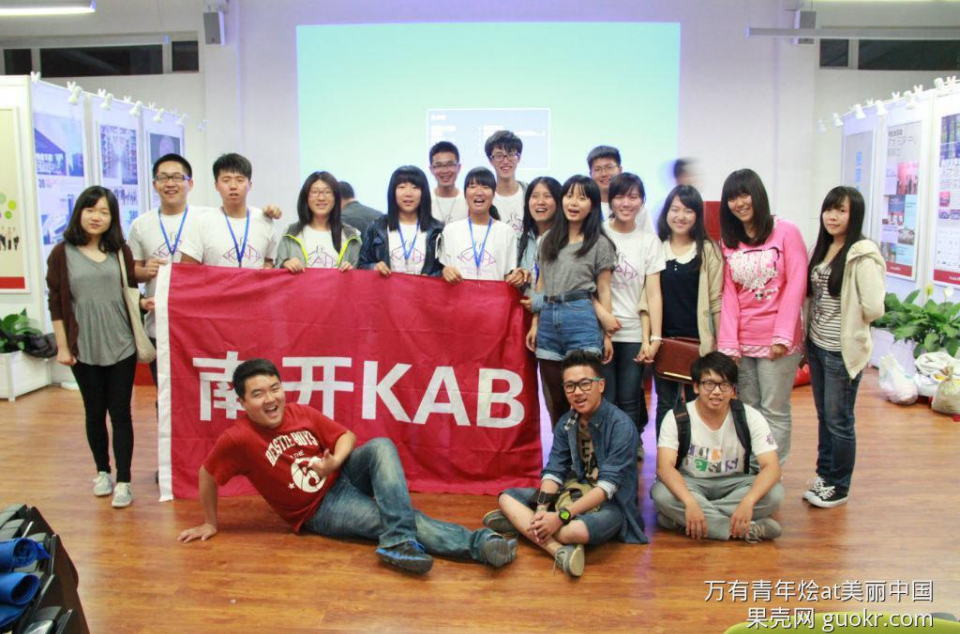
万有青年烩at美丽中国 果壳网 guokr.com