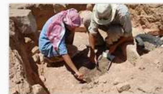
考古学不可告人的小秘密 具体日期待定